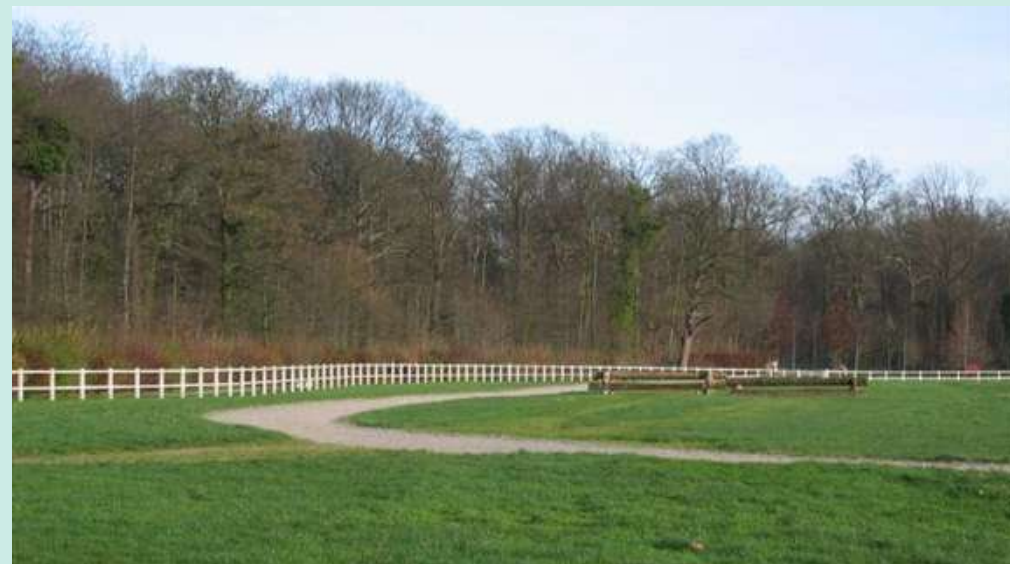
PISTE DE GALOP